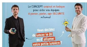
MANAGEMENT SST PREVANCE Pack VIGILANCE Attitude

Purificateur d'air breveté, éco-conçu, fabriqué en France.