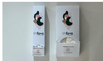
SERVICE AUX COLLABORATRICES FAVA FAVOPRO

Barrière Virtuelle - Ligne de Vie et de Sécurité permettant de protéger les personnels.