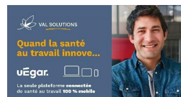
CONSEIL/FORMATION VAL SOLUTIONS uEgar®

Outil digital intelligent d'information et de sensibilisation aux risques professionnels, adapté à chaque collaborateur.