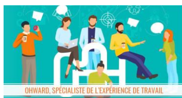
QVT/ BIEN-ETRE AU TRAVAIL OHWARD Dispositif O'STORY

L'éclairage bien-être et santé qui s'adapte aux rythmes de travail des salariés.