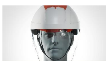
EQUIPEMENTS DE PROTECTION INDIVIDUELLE NEORATECH

Plateforme d'Apprentissage Immersif en 360° et Réalité Virtuelle.