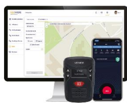
DISPOSITIF D'ALARME DU TRAVAILLEUR ISOLE NEOVIGIE VigieLink

Plateforme connectée de santé au travail et de prévention 100% mobile et collaborative.