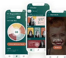
PREVENTION DES RPS TEALE

Outil de prévention des TMS basé sur la Motion Capture et la Réalité Virtuelle.