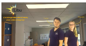
AMENAGEMENT DES ESPACES DE TRAVAIL LIBU

Le Prix de l'Innovation , composé d'un jury rassemblant des experts et professionnels en Santé, Sécurité au travail, des grandes entreprises, des organisations professionnelles, de la presse spécialisée récompensera 17 lauréats, lors de la remise de prix, qui se tiendra le mardi 30 novembre à Porte de Versailles .