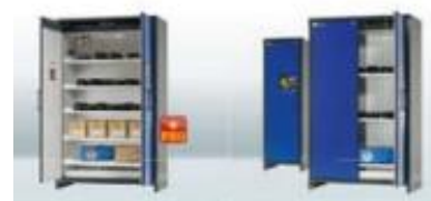
PRODUIT DANGEREUX/ RISQUE CHIMIQUE ASECOS

Service sur-mesure de mise à disposition de protections intimes 100% Bio.