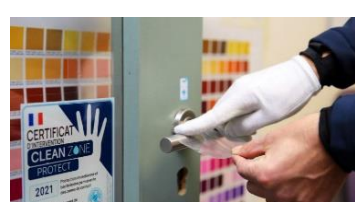
HYGIENE / HYGIENE DE L'AIR CLEAN ZONE PROTECT

Equipements de protection individuelle avec de la technologie embarquée.