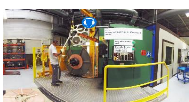
E FORMATION / REALITE VIRTUELLE UPTALE

Solution globale clé en main pour alerter et porter assistance au travailleur isolé.