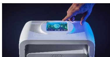
HYGIENE / HYGIENE DE L'AIR NATESOSANTE EOLIS Air Manager

Film antimicrobien contre les virus et les bactéries, actif 24h/24, 7j/7 jusqu'à 5 ans.