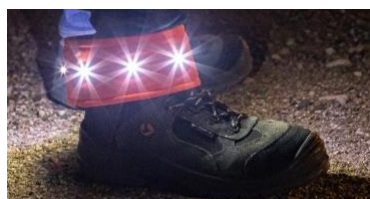
SECURITE DE LA PRODUCTION ET DES CHANTIERS MY ANGEL PTI-DATI LVSL / SAFE INNOV

Barrière Virtuelle - Ligne de Vie et de Sécurité permettant de protéger les personnels.