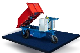
MANUTENTION / TRAVAUX EN HAUTEUR K-RYOLE Kross Builder

Chariot électrique de manutention intuitif et utilisable par tous.